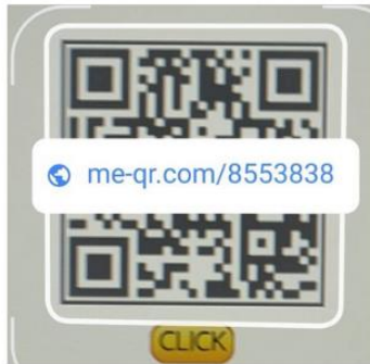
ตัวอย่าง 2.1.1

2.1.2 ให้ทำการกด link เพื่อเข้าสู่แบบฟอร์มรับบริการ